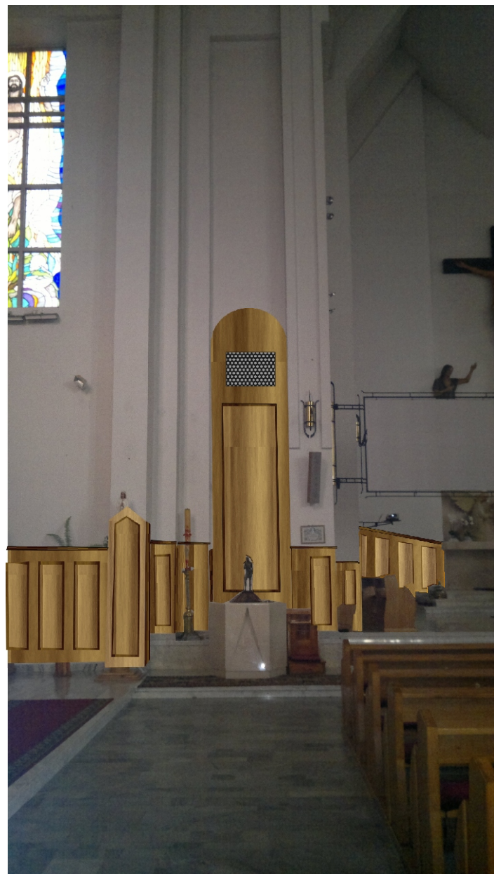
Wizualizacja ściany z chcielnicą ( okładzina drewniana z elementem ekspozycyjnym dla rzeźby lub obrazu ) (zasłonięcie ażurową ozdobną siatką otworu grzejnego ) (wymiary i kształty rozrysowane na ścianie)