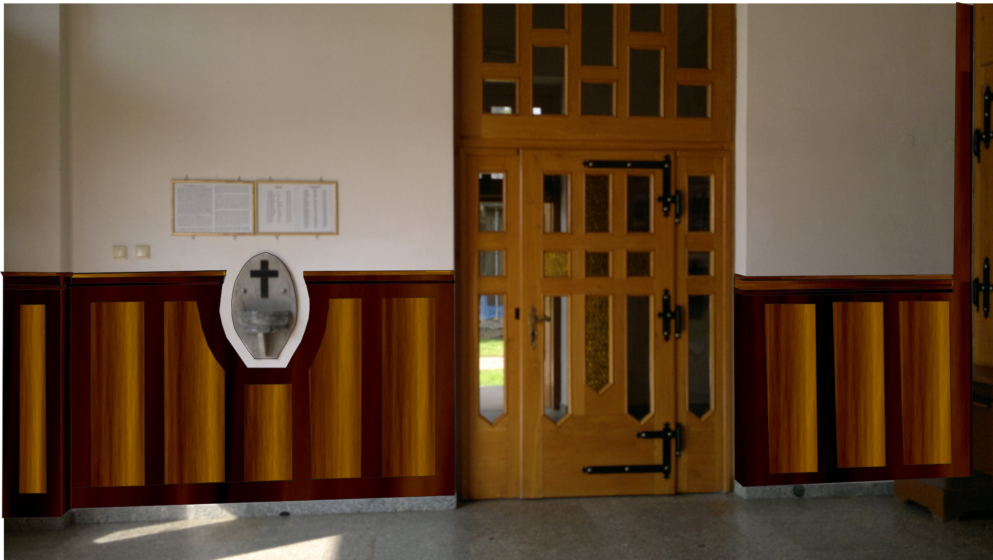
BESKO - KRUCHTA