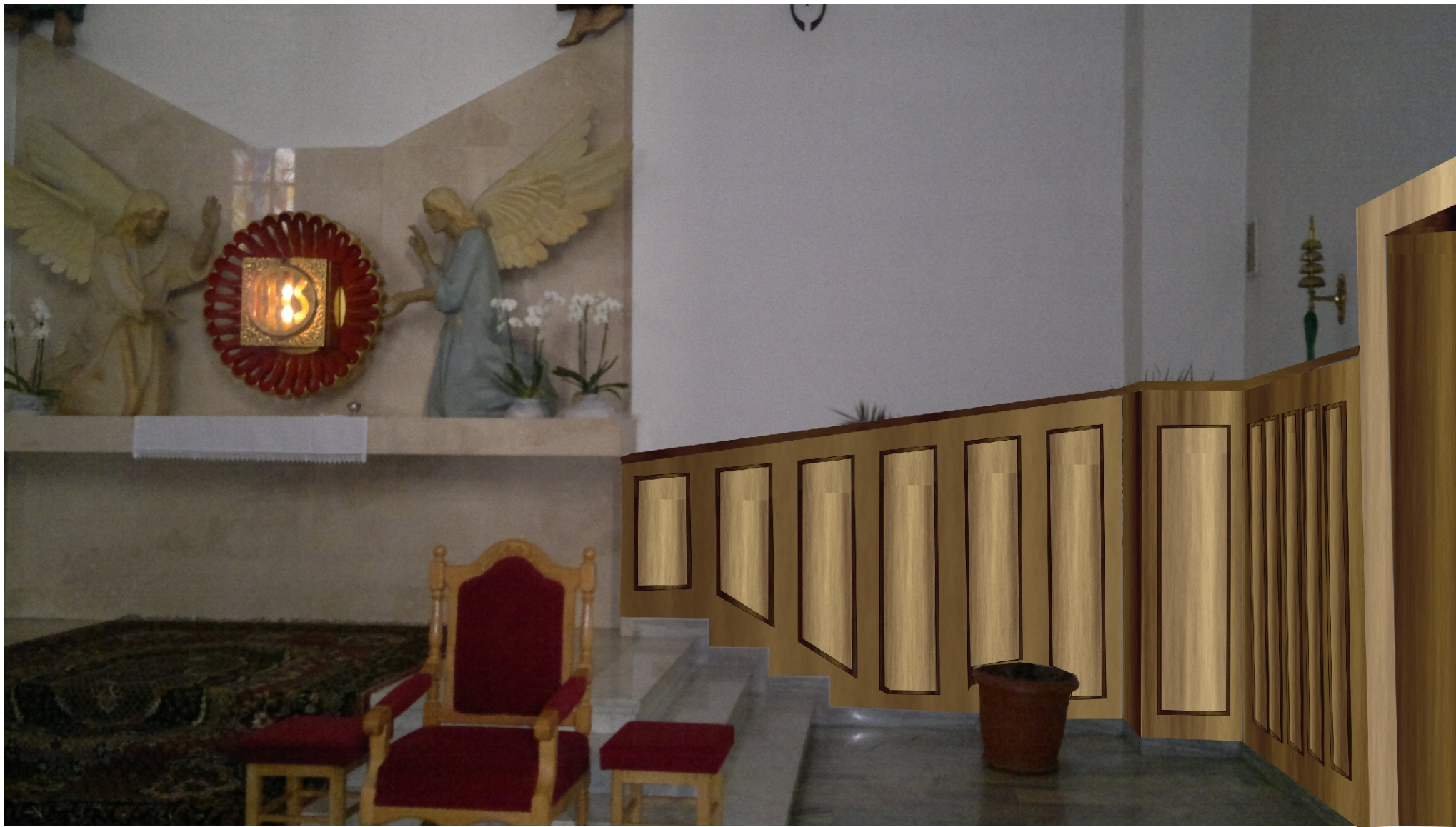
Wizualizacja ściany w prezbiterium (okładzina drewniana)

(wymiary i kształty rozrysowane na ścianie)